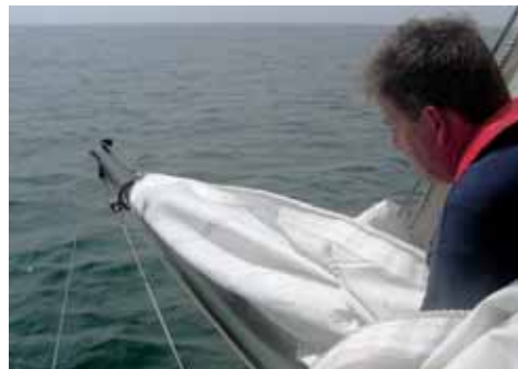
Hijsen: Trek de traveller met de halshoek eraan vast op de kluiverboom naar voren.

is het zwaar werk, dan heeft de kluiver de meeste neiging ver uit te waaien of zelfs in het water te raken.