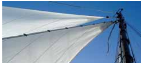
Het kluiverval zit gedraaid, dat maakt het hijsen en vooral het strijken extra zwaar.

Hijsen en strijken gaat goed op aan de windse of ruime koersen. Het makkelijkst is natuurlijk voor de wind varend als de kluiver in de luwte van de fok hangt. Bij halve wind