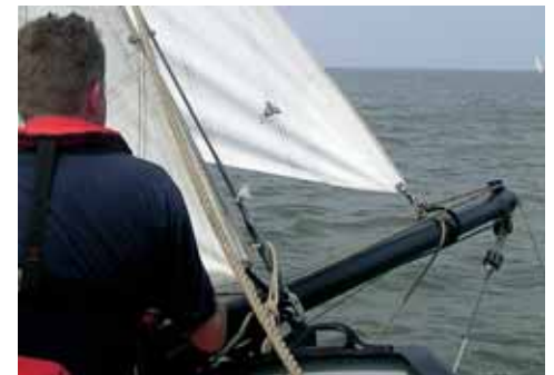
Strijken: Haal de traveller met de kluiver naar achteren voordat het val wordt gevierd.