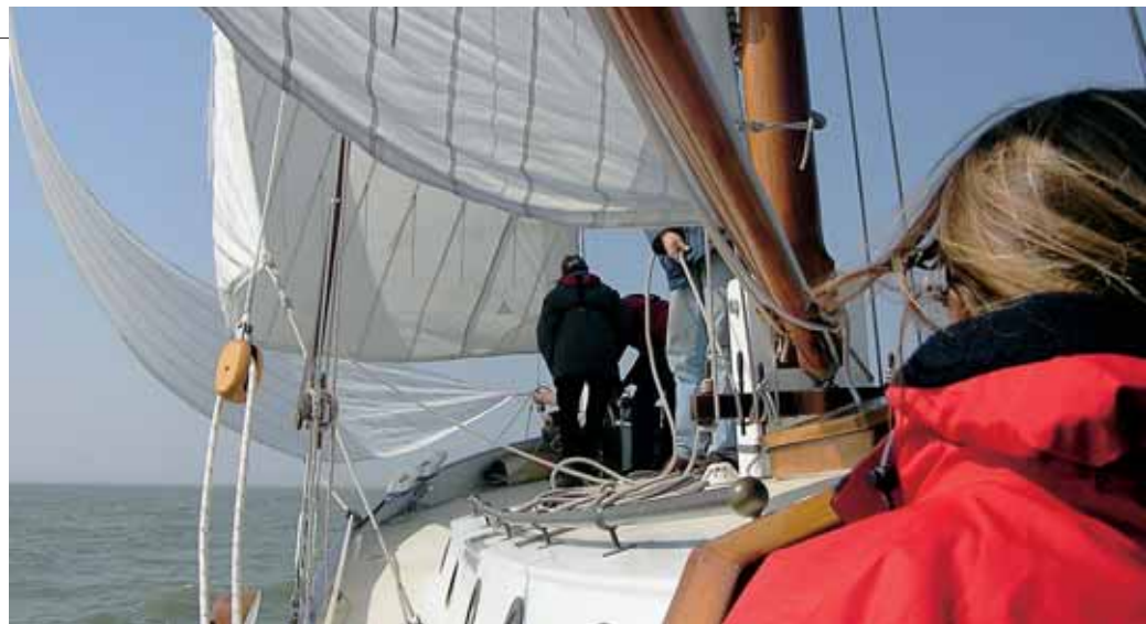
Geef, bij het hijsen van de kluiver de schoot voldoende vrijheid. Ook weer niet zo veel dat de kluiver wild gaat klapperen.

aan het teken van de zeilmaker, bij de schoothoek zitten de schoten er bij voorkeur nog aan, de tophoek is nog over, daar schrijft je met viltstift een grote "T" op. Bevestig de halshoek aan de traveller, de tophoek aan het val en