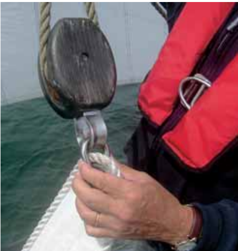
Het kluivervalblok wordt aan de tophoek vastgezet met een sluiting.

Om vlot te kunnen hijsen is het handig om de kluiver op te ruimen in een zeilzak met de drie hoeken naar buiten. De halshoek herken je