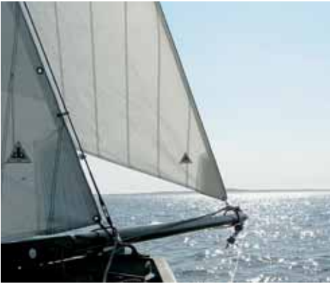
Als de kluiver vliëgend wordt gehesen, waait hij al gauw te veel uit. Het is zaak het val op een lier goed door te zetten.

den. Dat is een belangrijke factor om de kluiver optimaal te kunnen trimmen.