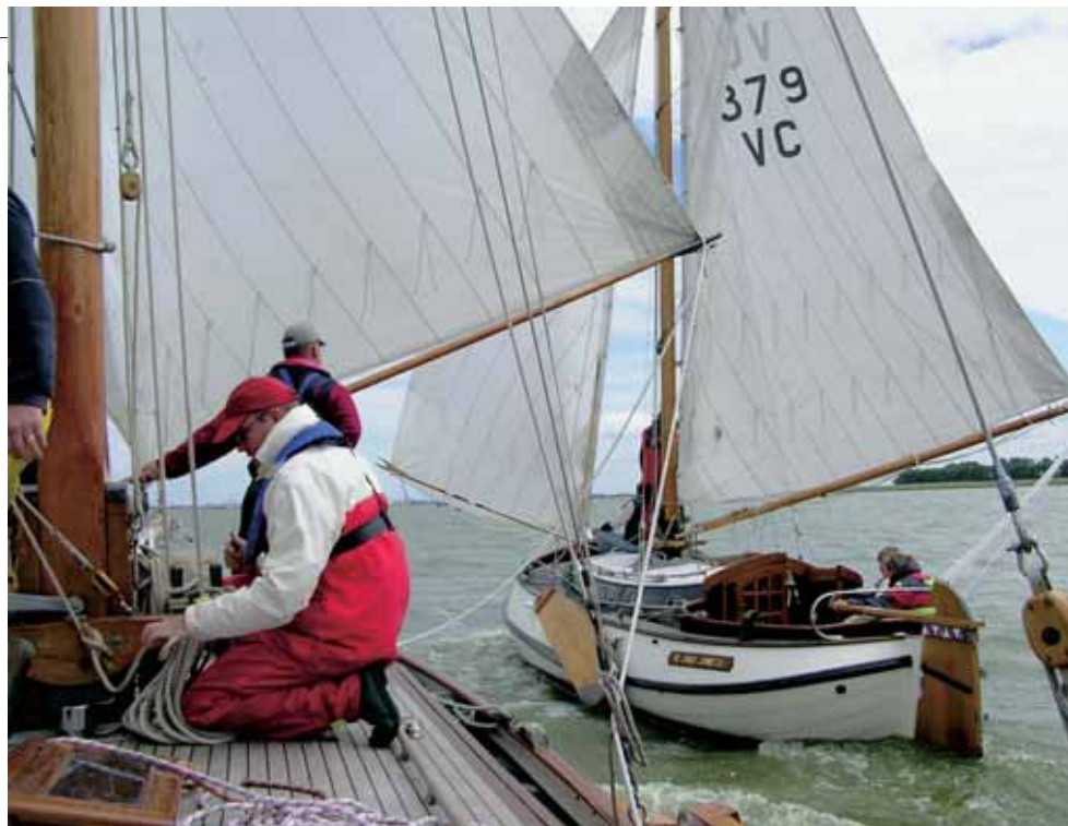
Jonge Jannetje en de Windstreek zitten elkaar op de hielen.

goed te maken. Dus blijkt later dat zij toch beter gezeild hebben dan wij. Hoe is het mogelijk vragen wij ons af met zoveel talent aan boord van de Windstreek .”