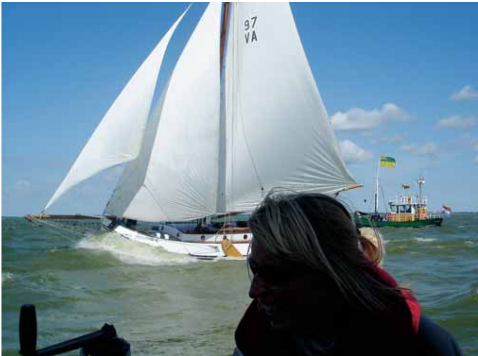
Klassen 1 en 3 starten en we varen de H-baan.

me avond, waarin wij als bemanningsleden ook elkaar beter leren kennen, was het fundament gelegd voor een strijdvuldig zeilweekend.”